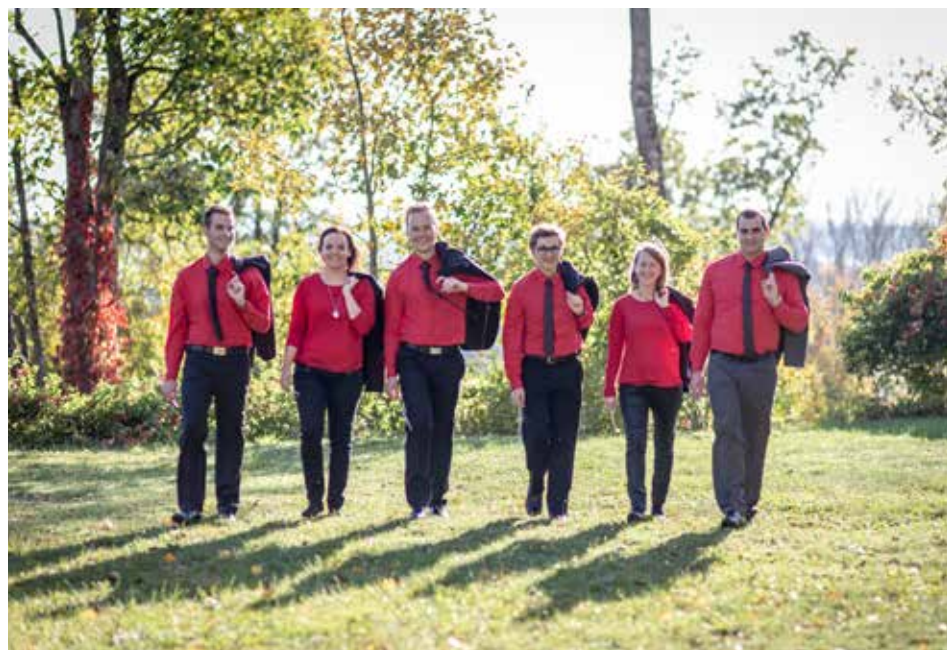
Die erfolgreichen Absolventen des Kapellmeisterkurses