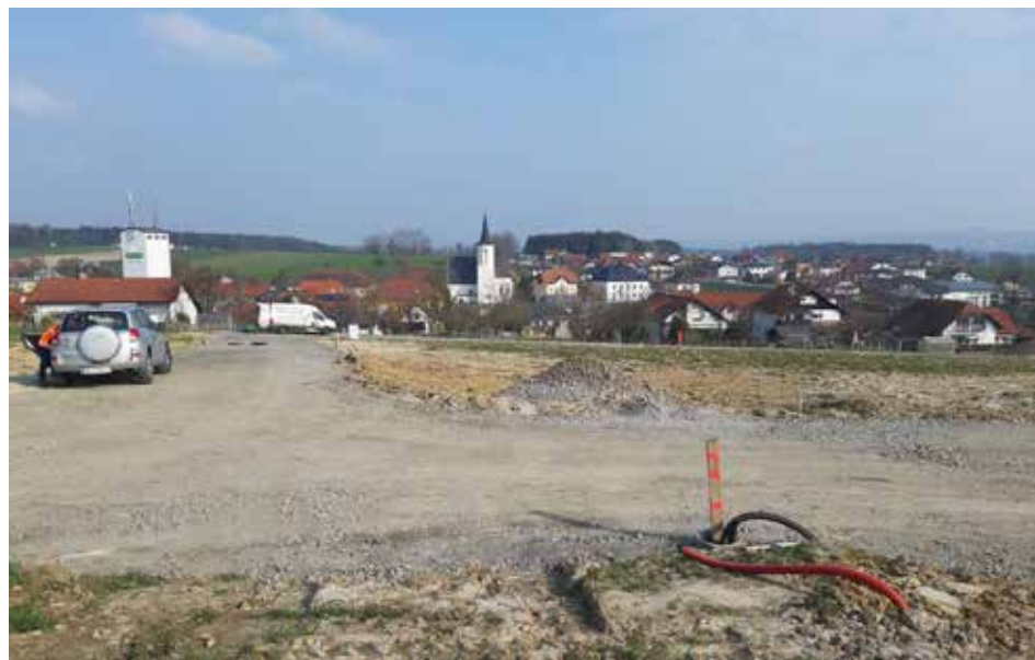
Blick auf die neuen Baugründe Am Bäckerberg

Ich denke, dass das Bürgerservice, die Verwaltung und der Dienst am Bürger in St. Thomas sehr gut funktionieren. Es wird jeder sofort bedient, die Mitarbeiter sind freundlich, hilfsbereit und zuvorkommend. Kritik, Beschwerden, Anregungen werden offen und ehrlich angenommen und ernst genommen.